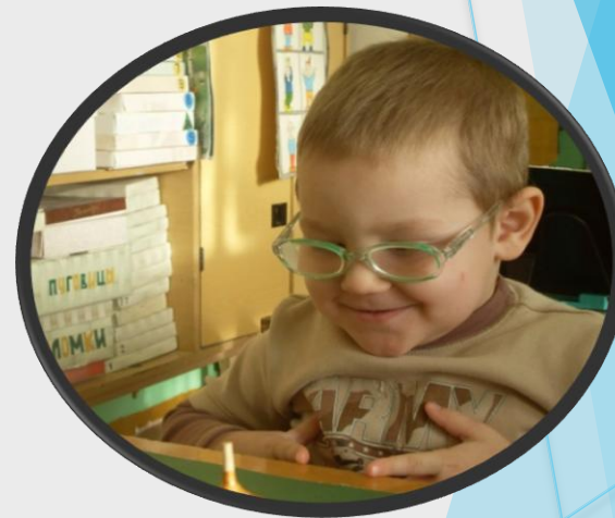
коррекция нарушений зрения