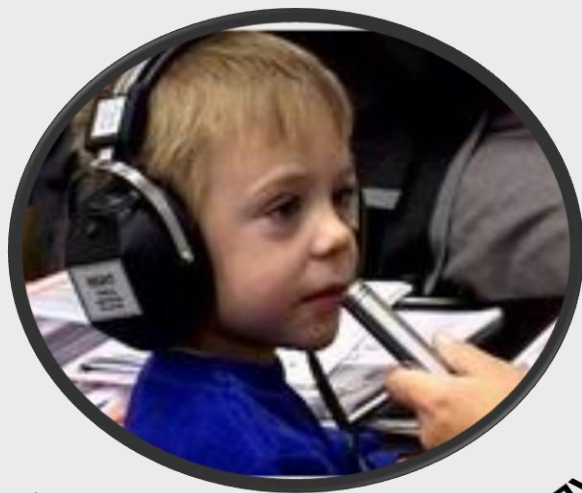
коррекция нарушений слуха