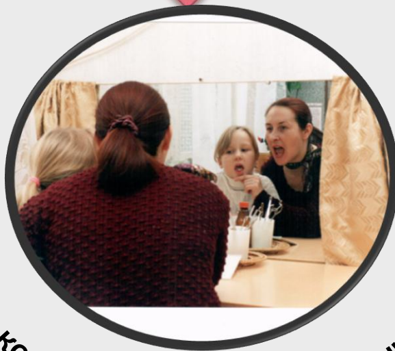
коррекция нарушений речи